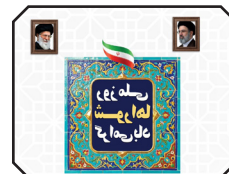
پیام شهردار بندرعباس به مناسبت روز شوراها