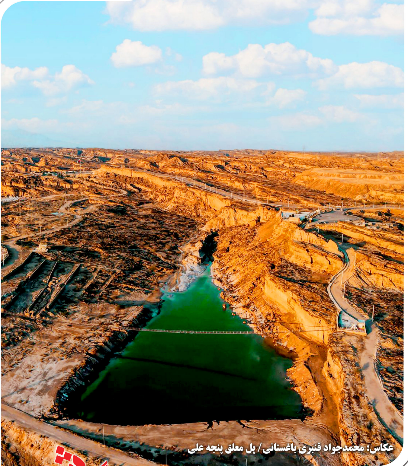
پل معلق بنجه علی