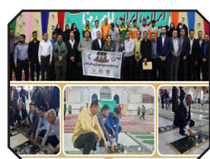
آیین غبارروبی گلزار شهدای بندرعباس به مناسبت هفته بسیج کارگری برگزار شد