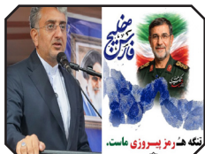
پیام شهردار بندرعباس به مناسبت روز ملی خلیج فارس