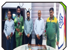
تقدیر از تلاشگران عرصه خدمت در سازمان ساماندهی مشاغل شهری و فرآورده های کشاورزی شهرداری بندرعباس به مناسبت روز کار و کارگر