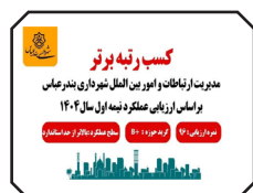
کسب رتبه برتر امور بین الملل شهرداری بندرعباس در ارزیابی عملکرد نیمه اول سال ۱۴۰۴