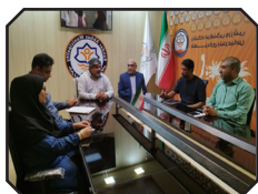
برگزاری جلسه هم اندیشی تیم فوتبال بزرگسالان شهرداری بندرعباس