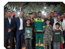
بوستان ساوانای ۲ در بندرعباس به بهره برداری رسید