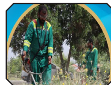
آغاز عملیات زیباسازی و ارتقای کیفیت منظر در آرامستان بندرعباس