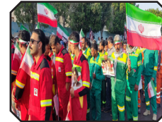
حضور فعال نیروهای پایگاه های بسیج شهرداری بندرعباس در گردهمایی جان فدایان امام رضایی