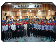
آتش نشانان باید با صداقت، مسئولیت پذیری و روحیه ایثار در خدمت شهروندان باشند