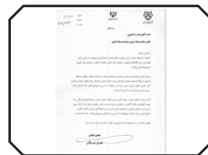
دستور قاطع شهردار بندرعباس برای تداوم خدمات شهری و صیانت از حقوق کارکنان در شرایط بحرانی